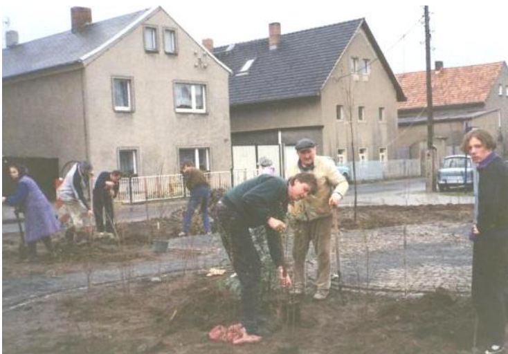
Bepflanzung des neu gestalteten Dorfplatzes

Auch in Zerna wurde der Dorfplatz ausgebaut und erhielt eine Straßenbeleuchtung. Darüber hinaus wurde die Straße Zur Schmiede ausgebaut und erhielt eine neue Straßenbeleuchtung sowie eine Straßenentwässerung. Saniert wurde auch ein Teil der Straße Am Sägewerk mit dem Containerstellplatz. Außerdem wurde ein Spielplatz gebaut und es wurden die Straße und Grundstücke des Wohngebiets Am Hügel mit Straßenentwässerung und Straßenbeleuchtung erschlossen.