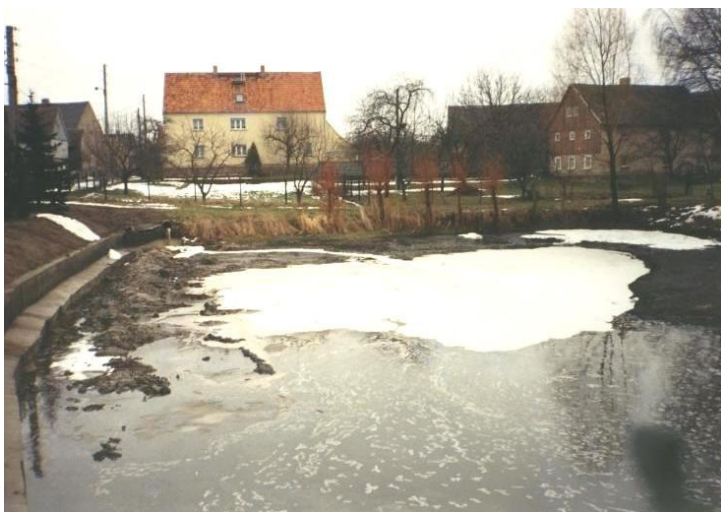
Dorfteich in Gränze

Durch den Freistaat Sachsen erfolgte der grundhafte Ausbau der Staatsstraße S 101 von Naußlitz nach Crostwitz, die auch an Gränze vorbei führt.