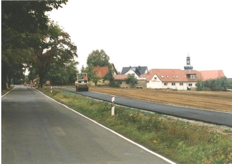
Bau des Radweges zwischen Rosenthal und Zerna