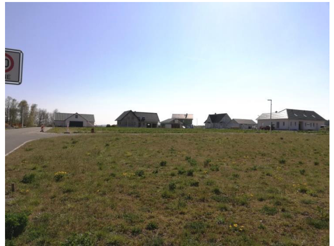
Erste Eigenheime im neuen Wohngebiet Rosenthaler Straße

Weiterhin kaufte die Gemeinde zwei Hektar Bauerwartungsland und plante diese Fläche als Bauland. So wurde das Wohngebiet Rosenthaler Straße für 16 Eigenheime mit Schmutz- und Straßenentwässerung, Strom, Erdgas, Straße und Straßenbeleuchtung erschlossen. Mittlerweile sind die ersten Eigenheime gebaut und bewohnt, weitere befinden sich im Bau.