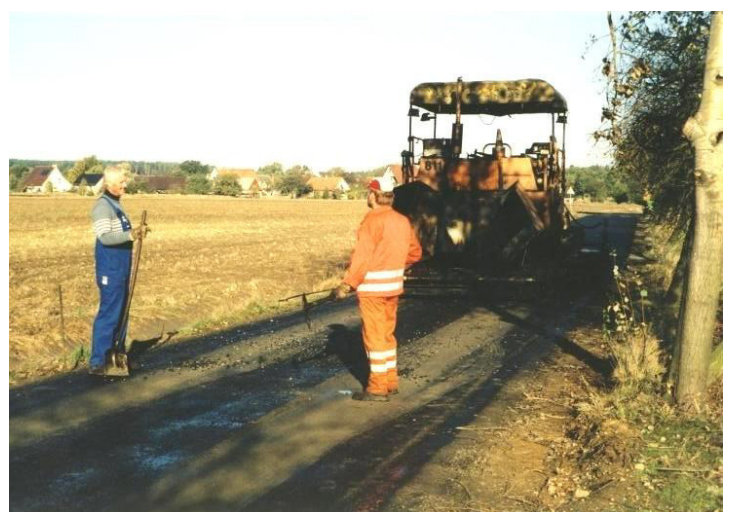
Erneuerung der Straße zwischen Gränze und Horka