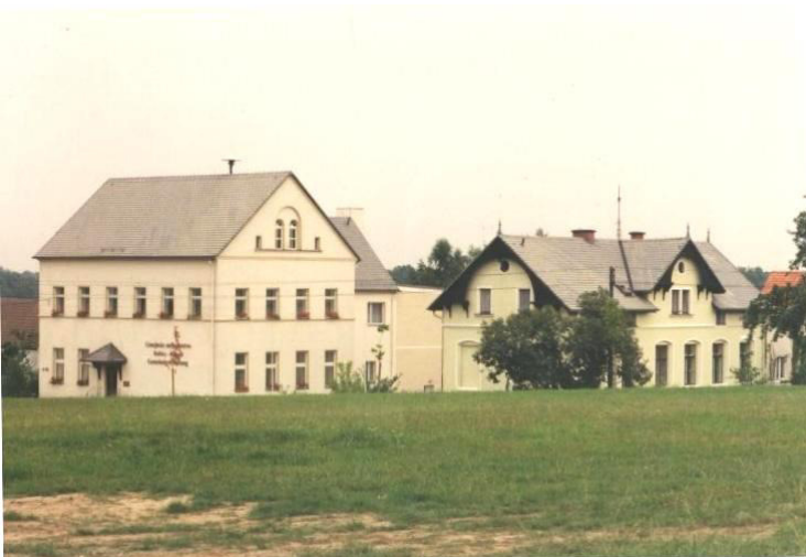
Sanierter Gebäudekomplex der Gemeindeverwaltung

In Rosenthal, dem heutigen Sitz der Gemeinde, wurde der Gebäudekomplex der Gemeindeverwaltung und der dazugehörigen Nebengebäude komplett saniert. Dazu gehörten die Dächer, Fassaden, die Heizung, die Sanitäreinrichtungen, die Fenster und der Innenausbau. Darüber hinaus wurde ein Jugendclub eingerichtet und der Ortschaftsrat sowie die Vereine des Dorfes erhielten eigene Räumlichkeiten.