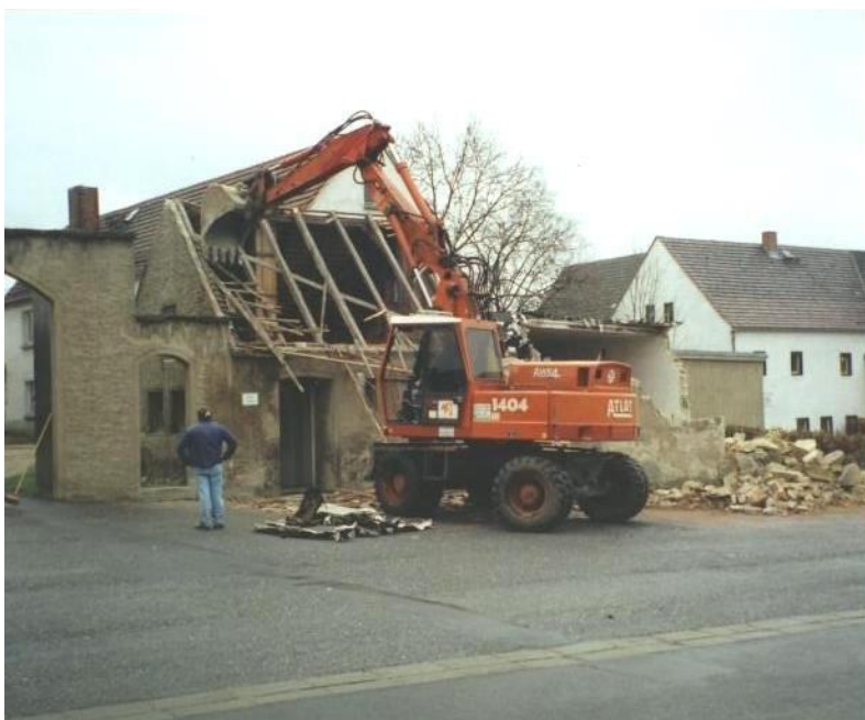
Abriss des alten Feuerwehrgerätehauses, jetzt Sanitäreinrichtungen an der Wallfahrtskirche