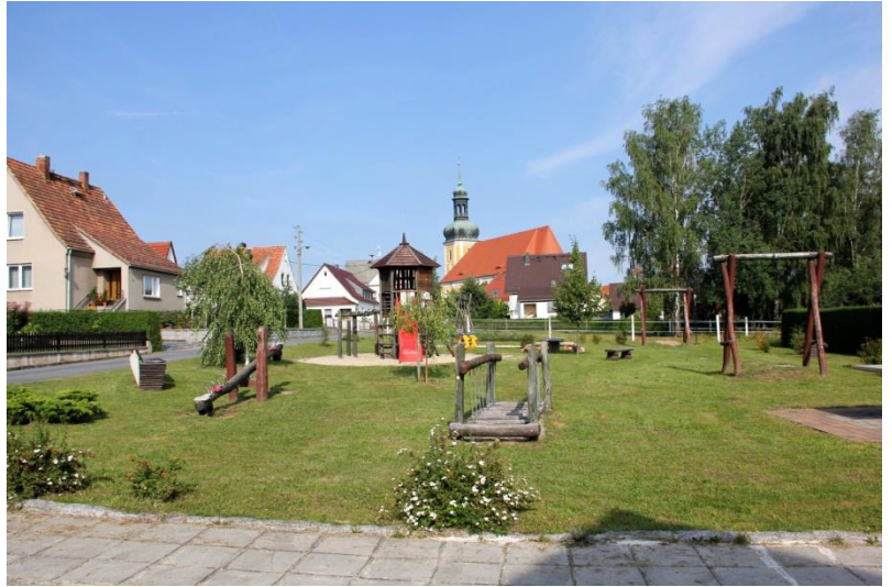
Neuer Spielplatz in Rosenthal

Um den aktuellen Anforderungen zu entsprechen, wurde die Kapelle an der Wallfahrtswiese saniert, der Wallfahrtsweg mit einer Straßenbeleuchtung ausgebaut und die Fläche an der Wallfahrtswiese gestaltet und bepflanzt. Die Bepflanzung erfolgte im Rahmen eines Projektes unter der Leitung der beiden Lehrer Michael Scholze und Michael Walde. Es erfolgte die Errichtung von Parkflächen gegenüber der Gemeinde und an der Gemeindeverwaltung. Auch die örtliche Feuerwehr wurde gefördert: Die Gemeinde erwarb ein Grundstück am Feuerwehrgerätehaus und die Feuerwehr übernahm ein gebrauchtes Feuerwehrfahrzeug der Freiwilligen Feuerwehr Rablitz.