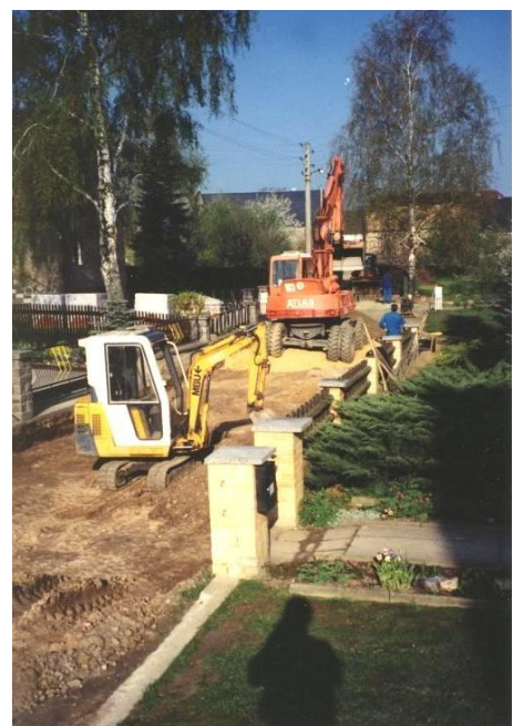
Ausbau der Georg-Schäfer-Straße