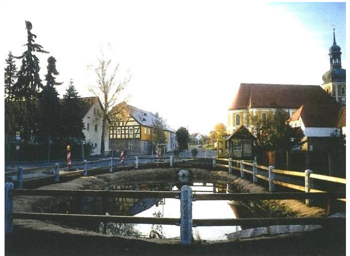
Der Dorfanger samt Teich unmittelbar nach der Erneuerung