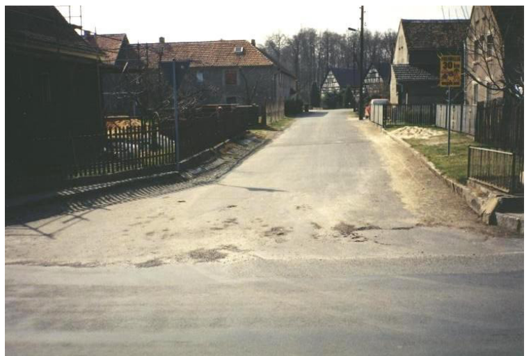
Straße Zur Schmiede