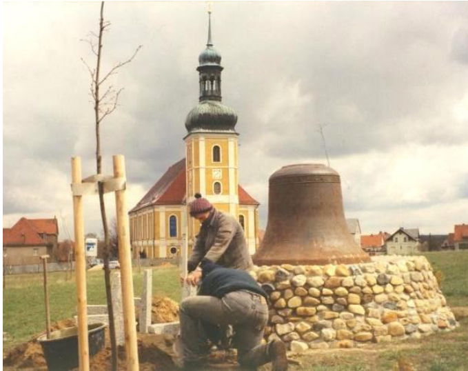
Gestaltung des Areals an der Wallfahrtswiese im Rahmen eines Projektes der Rablitzer Schule

Außerdem hat die Gemeinde ein Grundstück erworben, damit ein Spielplatz gebaut werden konnte. Saniert wurden ein Teil des Siedlungsweges, die Romuald-Domaschke-Straße sowie die Georg-Schäfer-Straße, die auch eine neue Straßenbeleuchtung erhielt. Auch der Parkplatz vor der Kirche wurde gestaltet und neu gebaut, ebenso wurde der Dorfanger samt Teich saniert und erhielt eine neue Straßenbeleuchtung.